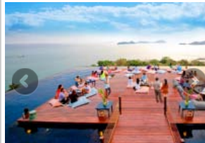
Baba Nest Phuket