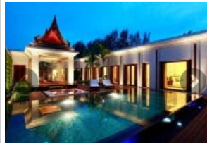
Maikhao Beach Villa Resort & Spa, Phuket